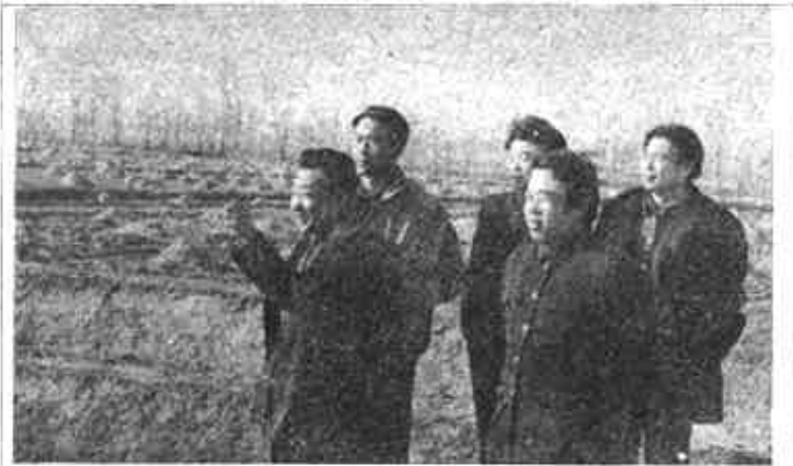
事业要发展，“班子”团结最关键。建林乡党委是大家公认的团结好、作风硬的领导班子。图为乡领导在田间制订粮林间作规划。

在这里，我们代表全乡人民，热诚欢迎一切有识之士来我乡参观、考察兴办各类经济实体，进行商贸活动，共展宏图，共兴大业。