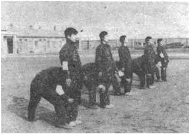
本版责任编辑 杨荣寅